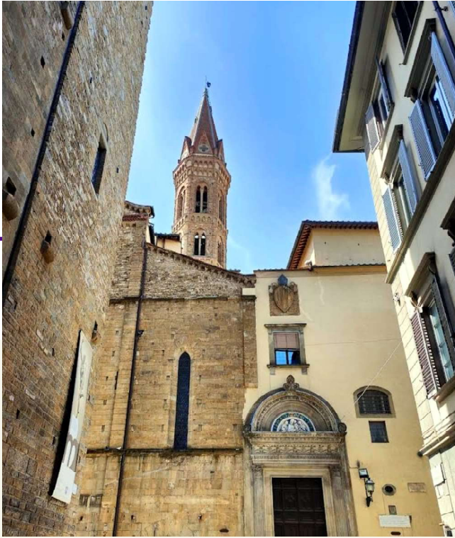
Uno scorcio della facciata della Badia con il campanile, maggio 2024.